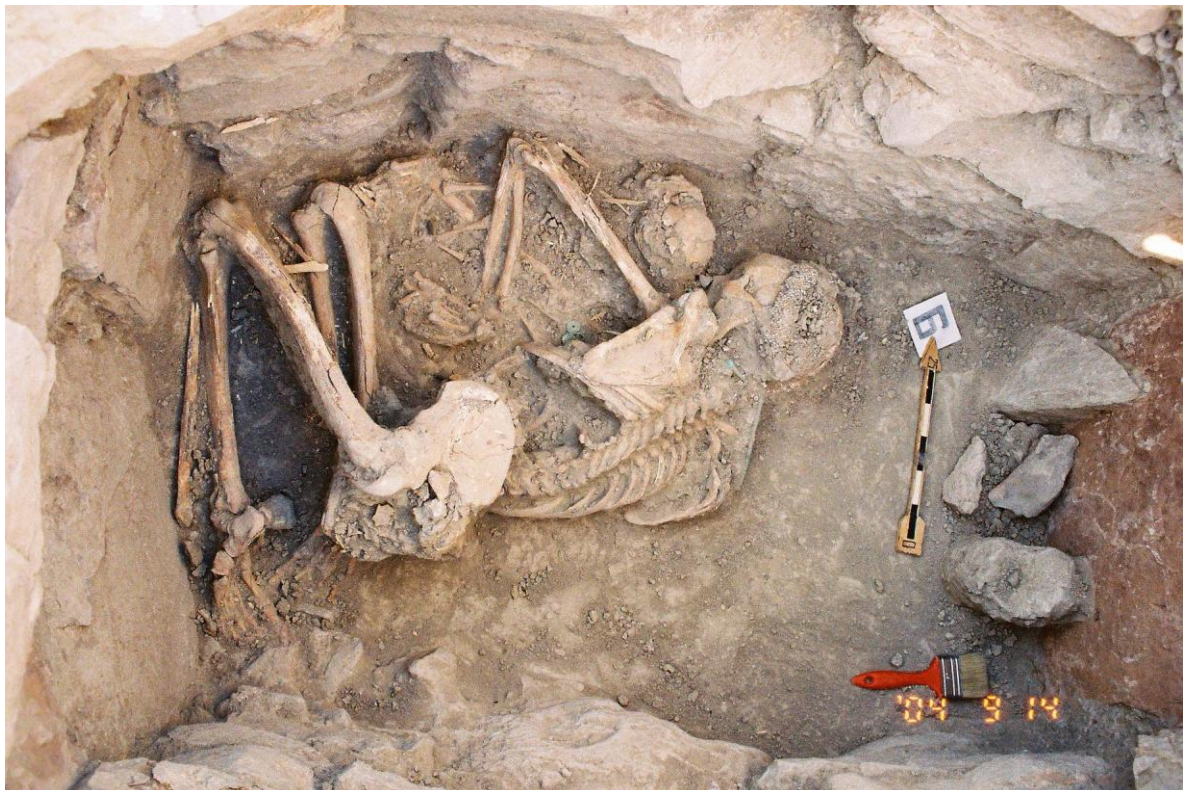
Şəkil 2. HİPlovdag. Dünyanın ən qədim döyüscü qadın qəbri