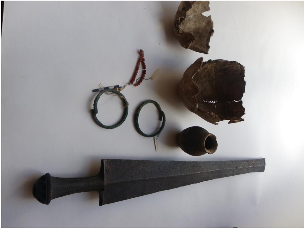
Şəkil 3. Semo-Avcala Gürcüstan döyüscü qadin qəbri